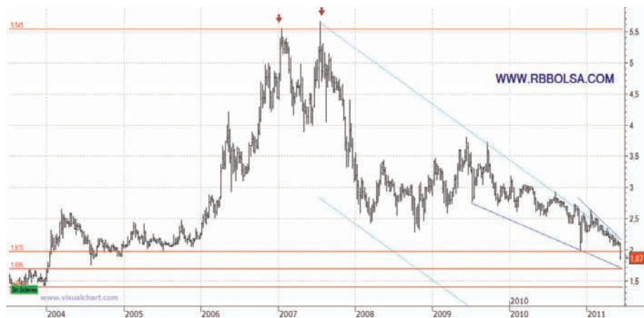
Gráfico 2. Evolución Tecnocom semanal