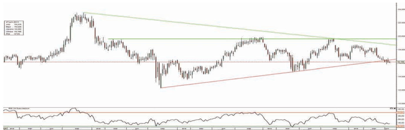
Gráfico 2. Evolución de Telefónica en los últimos cinco ejercicios ESPECIAL TRADING 2011 • 7