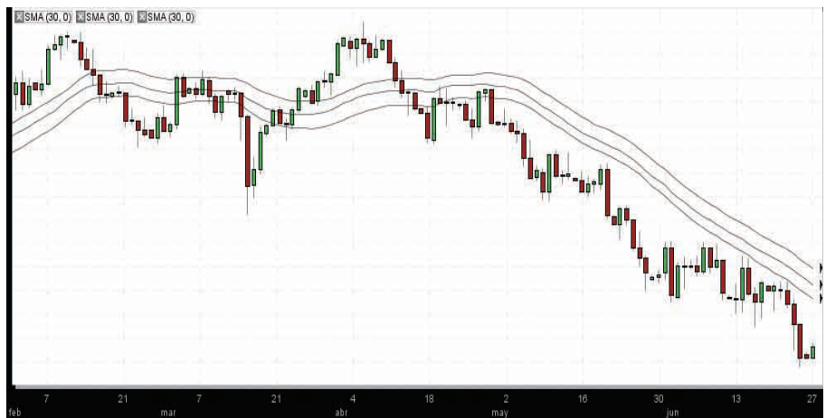
Divisa refugio. Gráfico diario Euro/Franco suizo

La idea se basa en una predicción de la evolución del activo para poder fijarse en su tendencia, siempre basado en informaciones del mercado; de esta manera se podrá maximizar el retorno. Otro punto importante es encontrar un punto de entrada firme para más tarde seleccionar el volumen de la posición, que desde anyoption se sitúa entre los 50 dólares y los 5.000, generalmente, de manera que no se arriesgue más del 1-5% de los fondos de su cuenta por cada operación separada.