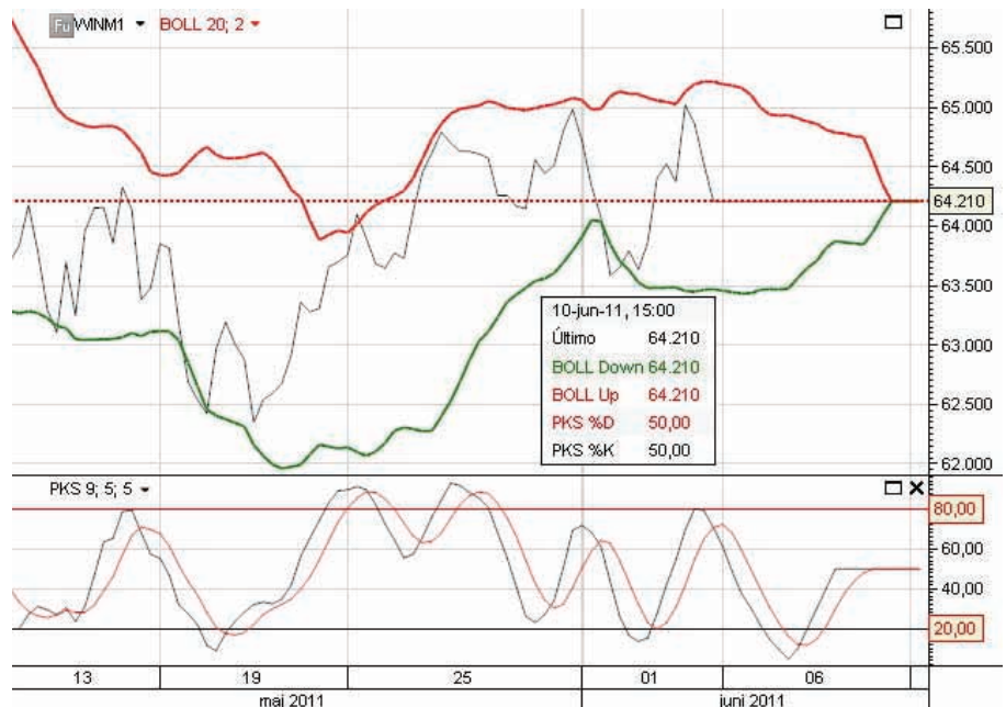
Gráfico 1. Futuro Bovespa 2 horas