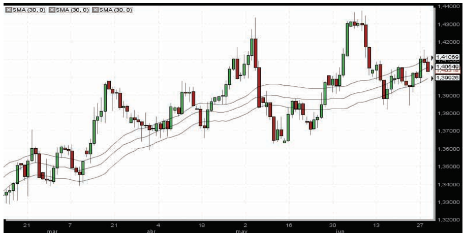
Divisa refugio Vs Divisa materia prima. Euro/Dólar canadiense