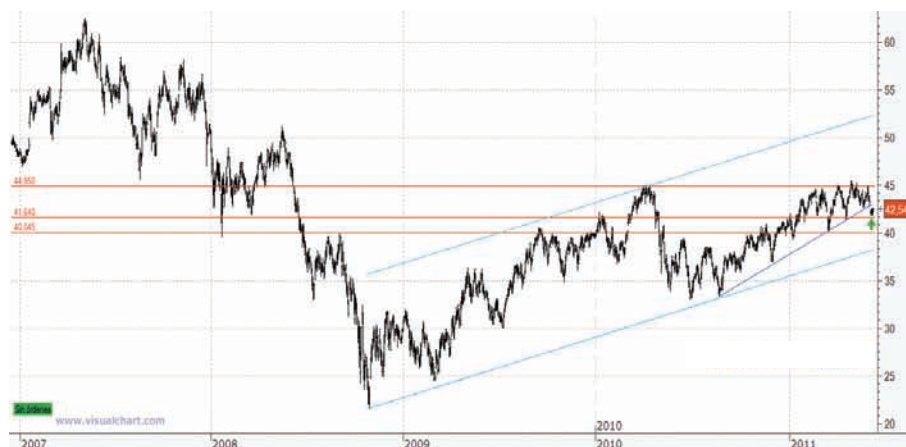
Gráfico 3. Evolución Vinci semanal