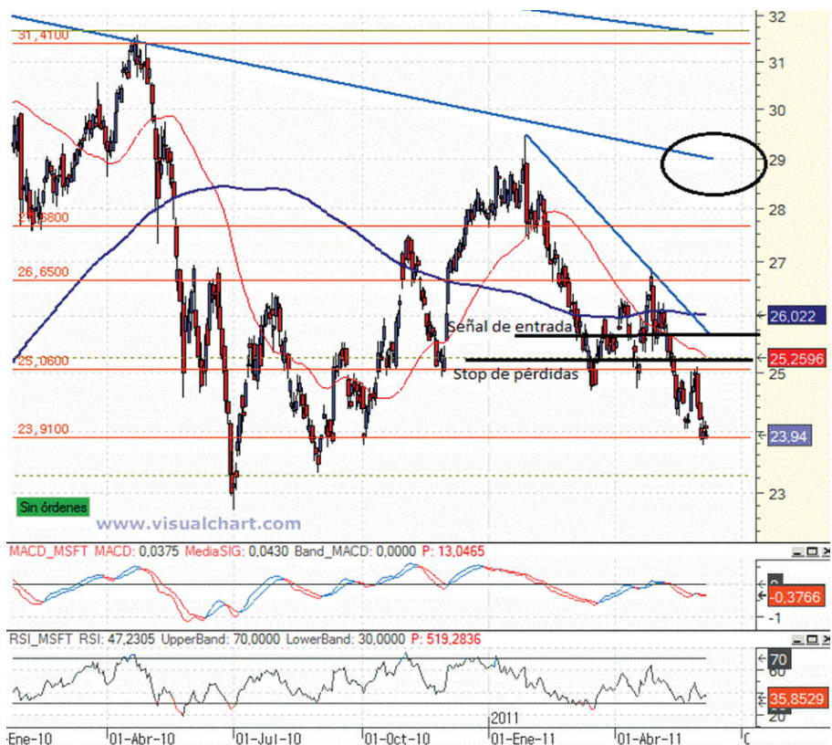
Gráfico 1. Evolución Microsoft diario

Otro valor a tener en cuenta es Vinci (ver Gráfico 3). Los resultados del primer trimestre confirman la tendencia de recuperación. Destaca la fortaleza de su cartera de pedidos, la diversificación geográfica de ingresos y su exposición a