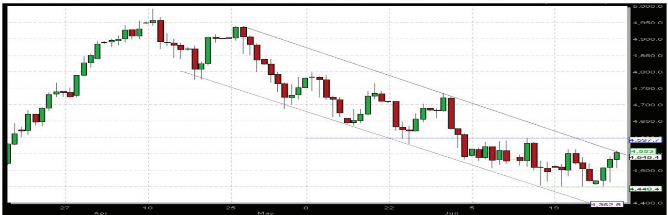
Gráfico 3. Tendencia bajista del Aussie 200