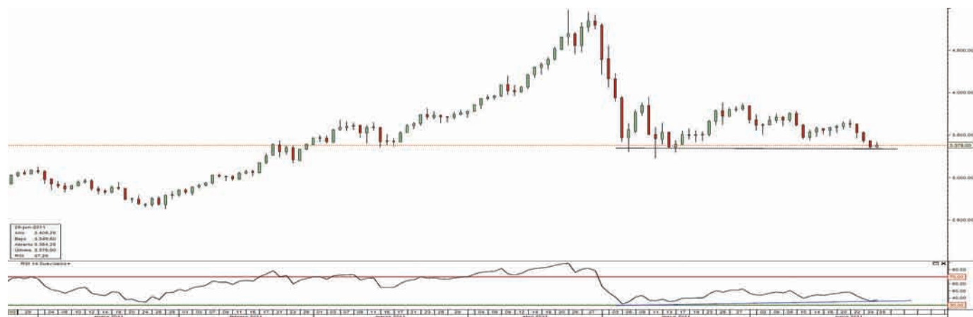
Gráfico 1. Evolución de la plata en los últimos seis meses

te de que tras la corrección vivida en el mes de mayo parece que el metal ha vuelto a la senda alcista con la formación de un patrón de mínimo creciente con divergencia alcista en el RSI”. Técnicamente, la superación de los 40 dólares “nos llevaría a la superación del posible rectángulo con implicaciones alcistas” (ver gráfico 1). De ahí que ActivoTrade recomiende tomar posiciones largas “en 34 dóla-