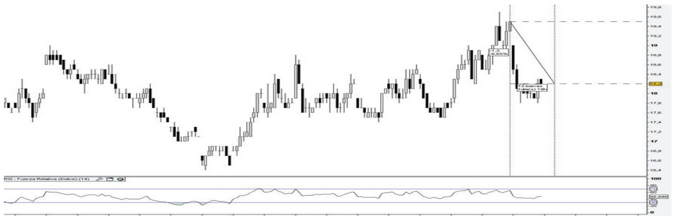
Gráfico 4. Evolución mensual del VIX